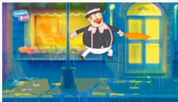
Mundo Bitá - Chuva Chove [clipe infantil]